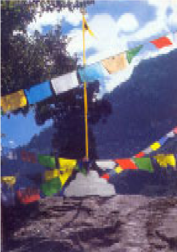
ਨਿਸ਼ਾਨ ਸਾਹਿਬ ਹੇਠਾਂ ਪੱਥਰ ਵਿਚ ਲੱਗੇ ਗੁਰੂ ਸਾਹਿਬ ਦੇ ਚਰਨਾਂ ਦੇ ਨਿਸ਼ਾਨ

ਪਿੰਡ ਦੇ ਵਿਚਕਾਰ 20 ਫੁੱਟ ਉੱਚੀ ਇਕ ਚਟਾਨ ਹੈ ਜਿਸ ਦਾ ਵਿਆਸ 30 ਫੁੱਟ ਹੈ। ਵਿਸ਼ਵਾਸ ਕੀਤਾ ਜਾਂਦਾ ਹੈ ਕਿ ਗੁਰੂ ਨਾਨਕ ਦੇਵ ਜੀ ਅਤੇ ਭਾਈ ਮਰਦਾਨਾ ਨੂੰ ਗੁਰੂਡੋਗਮਾਰ ਝੀਲ ਵੱਲ ਜਾਣ ਤੋਂ ਰੋਕਣ ਲਈ ਇਕ ਅਸੁਰ ਨੇ ਇਹ ਚਟਾਨ ਉਨ੍ਹਾਂ ਵੱਲ ਰੋੜ੍ਹੀ। ਚਟਾਨ ਗੁਰੂ ਸਾਹਿਬ ਨੂੰ ਲਗਣ ਦੀ ਥਾਂ ਉਨ੍ਹਾਂ ਦੇ ਚਰਨਾਂ ਕੋਲ ਡਿਗ ਪਈ। ਗੁਰੂ ਜੀ ਪੂਰਨ ਪ੍ਰਮਾਤਮਾ ਦੀ ਸਿਫਤ ਵਿਚ ਸ਼ਬਦ ਉਚਾਰਦਿਆਂ ਇਸ ਚਟਾਨ 'ਤੇ ਚੜ੍ਹ ਗਏ। ਗੁਰਬਾਣੀ ਸੁਣਕੇ ਅਸੁਰ ਗੁਰੂ ਸਾਹਿਬ ਦੇ ਚਰਨਾਂ 'ਤੇ ਢਹਿ ਪਿਆ ਅਤੇ ਆਪਣੇ ਸਾਰੇ ਕੁਕਰਮਾਂ ਲਈ ਪਸ਼ਚਾਤਾਪ ਕੀਤਾ। ਇਹ ਘਟਨਾ ਵੇਖਕੇ ਚੁੰਗਬਾਂਗ ਦੇ ਸਥਾਨਕ ਲੋਕ ਗੁਰੂ ਸਾਹਿਬ ਦੁਆਲੇ ਇਕੱਤਰ ਹੋ ਗਏ ਅਤੇ ਬੜੇ ਸਤਿਕਾਰ ਨਾਲ ਉਨ੍ਹਾਂ ਨੂੰ ਆਪਣਾ 'ਲਾਮਾ' ਕਿਹਾ। ਗੁਰੂ ਜੀ ਦੇ ਪਦ ਚਿੰਨ੍ਹ ਅਤੇ ਚਟਾਨ 'ਤੇ ਜਿਸ ਥਾਂ ਉਹ ਬੈਠੇ ਸਨ, ਉਨ੍ਹਾਂ ਦੇ ਅਜੇ ਵੀ ਦਰਸ਼ਨ ਕੀਤੇ ਜਾ ਸਕਦੇ ਹਨ। ਤਿੰਨ ਪਦ ਚਿੰਨ੍ਹ 3 ਤੋਂ 5 ਫੁੱਟ ਦੀ ਦੂਰੀ 'ਤੇ ਹਨ ਅਤੇ ਉਨ੍ਹਾਂ ਨੂੰ 'ਖਰਨ ਵੰਦਾ ਨਿਸ਼ਾਨ' ਕਿਹਾ ਜਾਂਦਾ ਹੈ। ਉਦੋਂ ਤੋਂ ਇਹ ਚਟਾਨ 'ਪੱਥਰ ਸਾਹਿਬ' ਦੇ ਨਾਂਅ ਨਾਲ ਜਾਣੀ ਜਾਂਦੀ ਹੈ। 'ਪੱਥਰ ਸਾਹਿਬ' ਦੇ ਅੰਦਰ ਇਕ ਛੋਟਾ ਜਿੰਨਾ ਕੁਦਰਤੀ ਚਸ਼ਮਾ ਹੈ। ਇਸ ਚਸ਼ਮੇ ਦਾ ਜਲ ਨਾ ਤਾਂ ਕਦੀ ਘਟਦਾ ਹੈ ਅਤੇ ਨਾ ਹੀ 'ਪੱਥਰ ਸਾਹਿਬ' ਤੋਂ ਬਾਹਰ ਜਾਂਦਾ ਹੈ। ਉਥੋਂ ਦੇ ਵਸਨੀਕਾਂ ਦਾ ਵਿਸ਼ਵਾਸ ਹੈ ਕਿ ਇਹ ਜਲ 'ਪੱਥਰ ਸਾਹਿਬ' ਦੇ ਹੇਠਾਂ ਵਗਦੀ ਇਕ ਪਵਿੱਤਰ ਝੀਲ ਦਾ 'ਪ੍ਰਸਾਦ' ਹੈ, ਅਤੇ ਇਸ ਜਲ ਨਾਲ ਚਮੜੀ ਦੇ ਹਰ ਤਰ੍ਹਾਂ ਦੇ ਰੋਗ ਦੂਰ ਹੋ ਜਾਂਦੇ ਹਨ। ਸਥਾਨਕ ਲੋਕਾਂ ਦਾ ਇਹ ਵੀ ਵਿਸ਼ਵਾਸ ਹੈ ਕਿ ਗੁਰੂ ਸਾਹਿਬ ਦੀਆਂ ਕੁਝ ਚੀਜ਼ਾਂ ਪੱਥਰ ਸਾਹਿਬ ਦੇ ਹੇਠਾਂ ਇਕ ਲੁਕਵੀਂ ਗੁਫਾ ਵਿਚ ਅਜੇ ਵੀ ਪਈਆਂ ਹਨ।