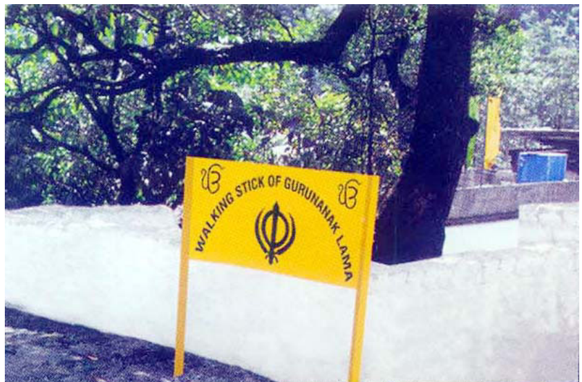
ਗੁਰਦੁਆਰਾ ਪੱਥਰ ਸਾਹਿਬ ਦਾ ਫੋਟੋ (ਬੈਂਕ ਆਫ ਪੰਜਾਬ ਦੇ 2003 ਦੇ ਛਪਾਏ ਕੈਲੰਡਰ ਦੇ ਆਧਾਰਤ)

ਗੁਰੂ ਨਾਨਕ ਦੇਵ ਜੀ ਨੇ ਇਸ ਚਟਾਨ ਦੇ ਹੇਠਾਂ ਇਕ ਗੁਫਾ ਵਿਚ ਕੁਝ ਰਾਤਾਂ ਬਿਤਾਈਆਂ। ਉਥੇ ਗੁਰੂ ਸਾਹਿਬ ਨੇ ਆਪਣੀ ਖੂੰਡੀ ਜ਼ਮੀਨ ਵਿਚ ਗੱਡੀ। ਇਹ ਖੂੰਡੀ ਹਰੀ ਭਰੀ ਹੋ ਗਈ ਅਤੇ ਵੱਧ ਕੇ ਇਕ ਬਿਰਛ ਬਣ ਗਈ। ਇਹ ਬਿਰਛ ਅਜੇ ਵੀ ਹੈ ਅਤੇ ਖੂੰਡੀ ਦੀ ਸ਼ਕਲ ਦਾ ਹੈ। ਇਸ ਬਿਰਛ ਨੂੰ 'ਬਾਬੇ ਦੀ ਖੂੰਡੀ' ਕਿਹਾ ਜਾਂਦਾ ਹੈ। ਲੋਕ ਕਥਾ ਅਨੁਸਾਰ ਗੁਰੂ ਸਾਹਿਬ ਦੀ ਇਕ 'ਪਾਵਨ ਪੁਸਤਕ' ਇਸ ਚਟਾਨ ਦੇ ਹੇਠਾਂ ਇਕ ਬੰਦ ਗੁਫਾ ਵਿਚ ਪਈ ਹੈ। ਇਸ ਦੀ ਰੱਖਿਆ ਲਈ ਚਟਾਨ ਦੀ ਦੱਖਣੀ ਬਾਹੀ ਵੱਲ ਇਕ ਚਸ਼ਮਾ ਫੁੱਟ ਆਇਆ। ਇਸ ਚਸ਼ਮੇ ਵਿਚ ਪਾਣੀ ਦੀ ਪੱਧਰ 5 ਫੁੱਟ ਦੇ ਕਰੀਬ ਰਹਿੰਦੀ ਹੈ ਅਤੇ ਇਹ ਕਦੇ ਨਹੀਂ ਸੁਕਦਾ।